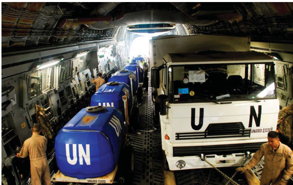
AFRICOM støtter blandt andet Rwanda med lufttransport til afløsning af UNAMID-styrken i Darfur. 24

De opgaver som AFRICOM skal kunne planlægge og lede, men som ikke indgår i de løbende operationer er: