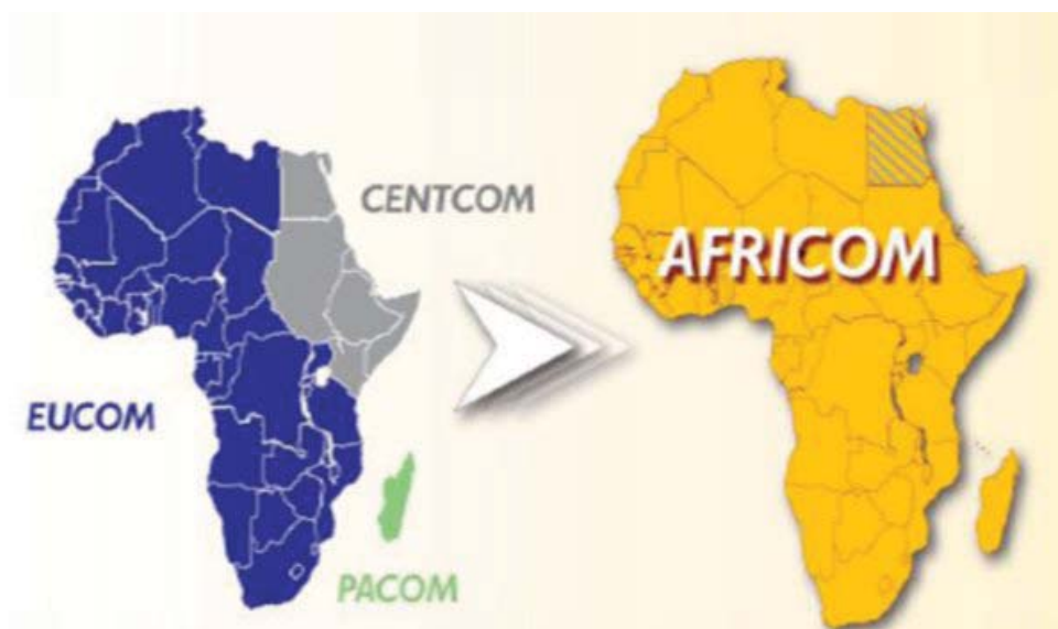
Figur 1: US Africa Command's ansvarsområde 2

Mange taler om Afrika som det glemte kontinent, og kontinentet som verden er ligeglad med. Denne holdning synes at have fået en drejning over det sidste 5-10 år, hvor flere og flere politikere taler om, at vi skal gøre noget for Afrika. Budene på hvad der skal gøres er dog ofte mere mudrede. Derfor er der også blevet skrevet og talt ganske meget om USA's etablering af AFRICOM, særligt i Afrika, hvor man på den ene side gerne vil have verdens opmærksomhed, men på den anden side måske ikke helt er klar til en amerikansk militærkommando. USA lancerede i 2007 omlægningen af sin militære strategiske kommandostruktur, således at Afrika fremover samles under en militær kommando mod de tre der førhen deltes om Afrika. En restrukturering af amerikanske militære kommandoer er i sig selv næppe en epokegørende begivenhed, men denne har fået ganske megen opmærksomhed dels fordi USA er blevet mere synlig i Afrika i forhold til kampen mod terror over de sidste to år, dels fordi USA med AFRICOM af mange opfattes som havende fusioneret sin udviklings- og sikkerhedspolitik med Pentagon som den styrende organisation. Slutteligt hævder mange, at USA aldrig har haft Afrika som et prioritetsområde, og det er det blevet med den nye kommando. 1