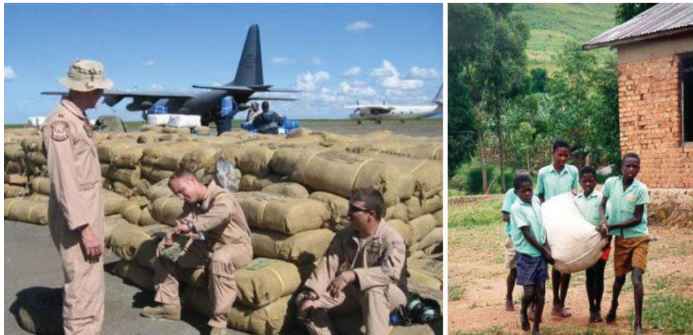
Eksempel på amerikansk militær og udviklingsmæssig støtte i Afrika 10,11