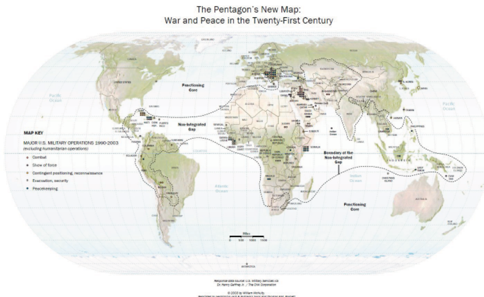
Figur 4: "The Core and Gap Thesis" af Barnett. 56

En flytning af kampen mod terrorisme er også nævnt ganske eksplicit i den nationale sikkerhedsstrategi som et forhold, der har et væsentligt fokus for USA. Her opstår et af dilemmaerne både i den aktuelle strategi og Barnett's "the Core and Gap Thesis", da USA både vil en langsigtet opbygning af afrikanske nationale og overnationale sikkerhedsregimer og forebyggelse af terrorisme (især Al-Qaeda) ved statsbygning og økonomisk udvikling. Samtidig vil USA kombinere sin preemptive strategi og den ovenfor nævnte leviathan-rolle, med militært at bekæmpe Al-Qaeda og Al-Qaeda-affilierede celler i Afrika. Problemet er blot, at overdreven brug af den sidstnævnte rolle, reducerer tilliden til USA's reelle intentioner set i forhold til den førstnævnte rolle. Derfor er det essentielt for USA at finde en balance mellem rollerne i Afrika for at fremstå som et troværdigt og ikke tvungent valg for afrikanske stater. Samlet peger det på, at USA indledningsvis vil fokusere på "low politics" områder i relation til Afrika syd for Sahara, men vil opbygge en militær kapacitet, der kan monitorere begivenheder i Afrika og løse den militære dobbeltrolle eventuelt efter tilførsel af militære enheder.