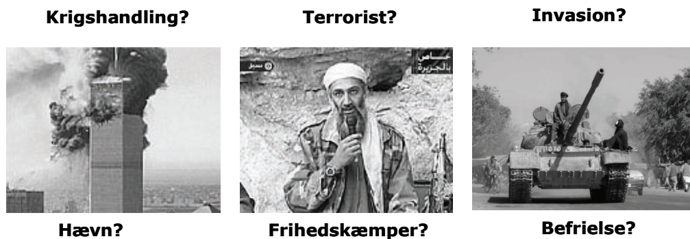
Figur 2.2. Konkurrerende narrativer. Grupper med forskellige overbevisninger og erfaringer konstruerer forskellige konkurrerende narrativer om den samme begivenhed.