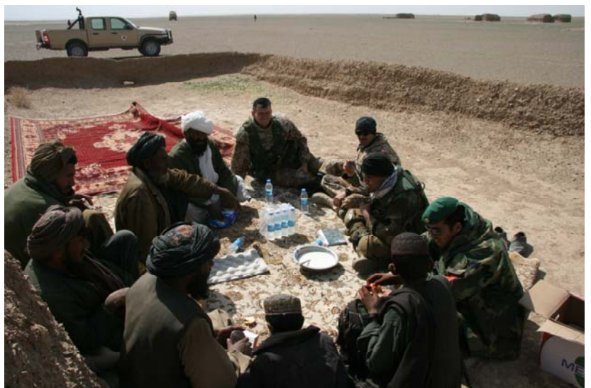
Shura i "Star Wars Village"