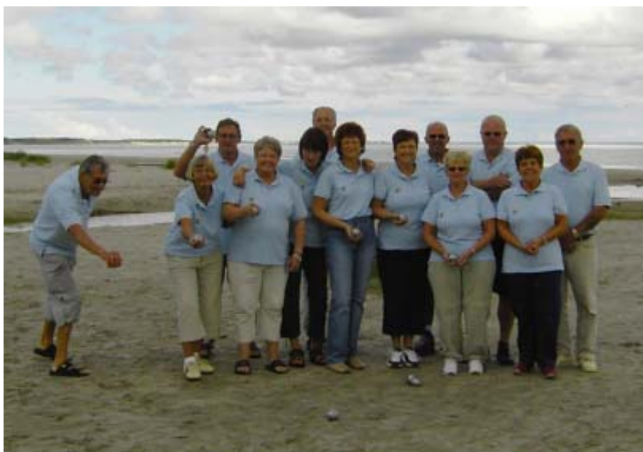
SIF Frederikshavns Pentanque spillere på stranden i Ålbæk

Vi har også haft 6 medlemmer i Tyrkiet med Petanque kuglerne, hvilket var en utrolig stor oplevelse for dem.