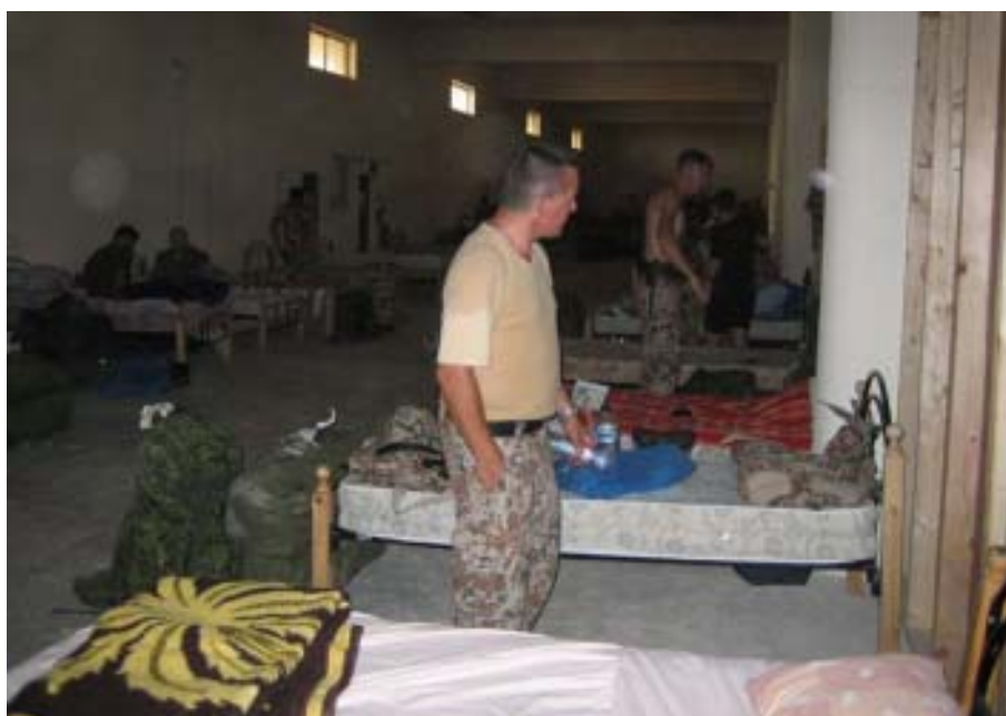
Man bor ikke ligefrem på luksus hoteller

Den stakkels rumæner har aldrig talt engelsk før, og er rystende nervøs over hvad man kræver i NATO. Jeg