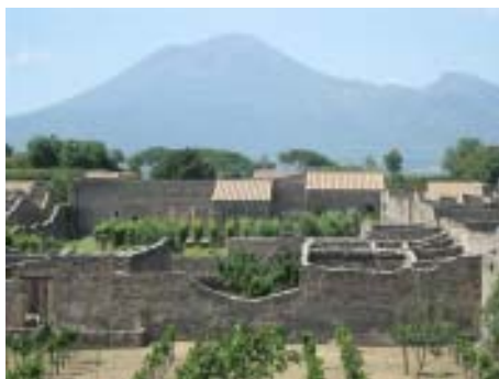
Pompeij med Vesuv i baggrunden

hvilket var helt fint, og vi lærte en masse om Irak. Det bedste var dog at vores fly skulle bruges til vigtigere ting end os, så vi fik en ekstra fridag i Napoli. Den blev udnyttet optimalt, og vi nåede både at se byen, men også Vesuv og Pompeji. Billeder kommer en anden gang, for det var helt fantastisk alt det vi nåede at se.