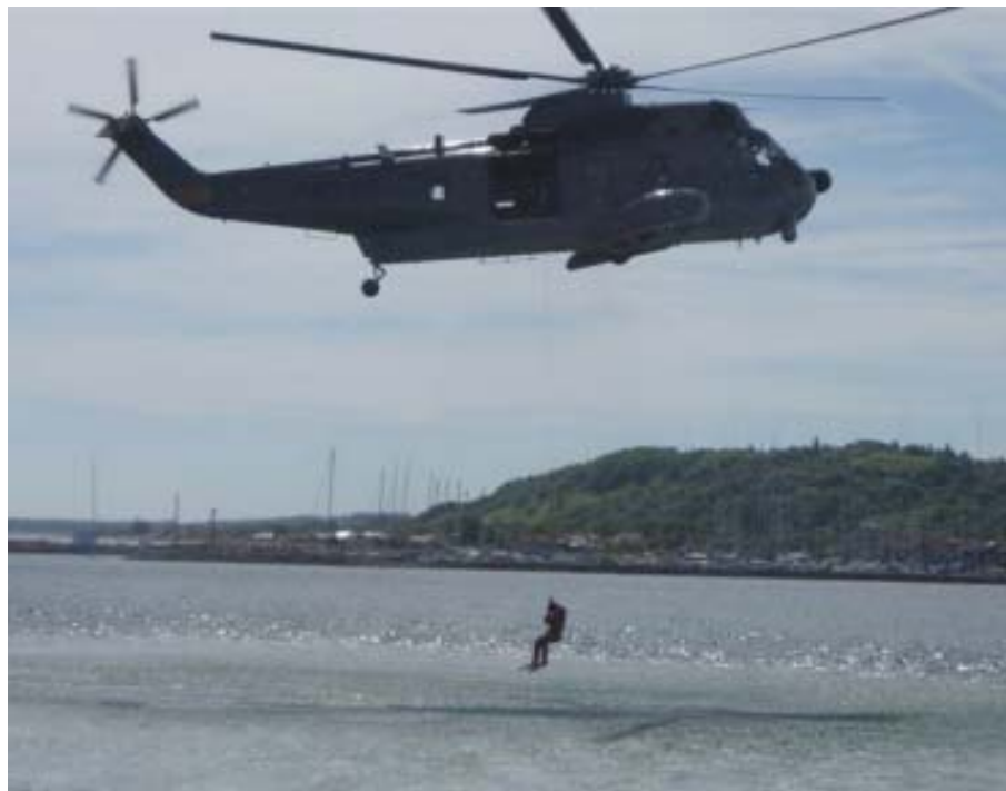
En Sikorsky helikopter demonstrerer redning af personer fra havet