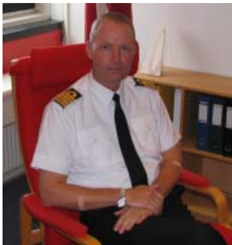
Introduktion af ny Chef for 1. eskadre. se side 3....