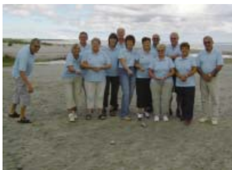
SIF Petanque spillere i mange sammenhænge. se side 14....