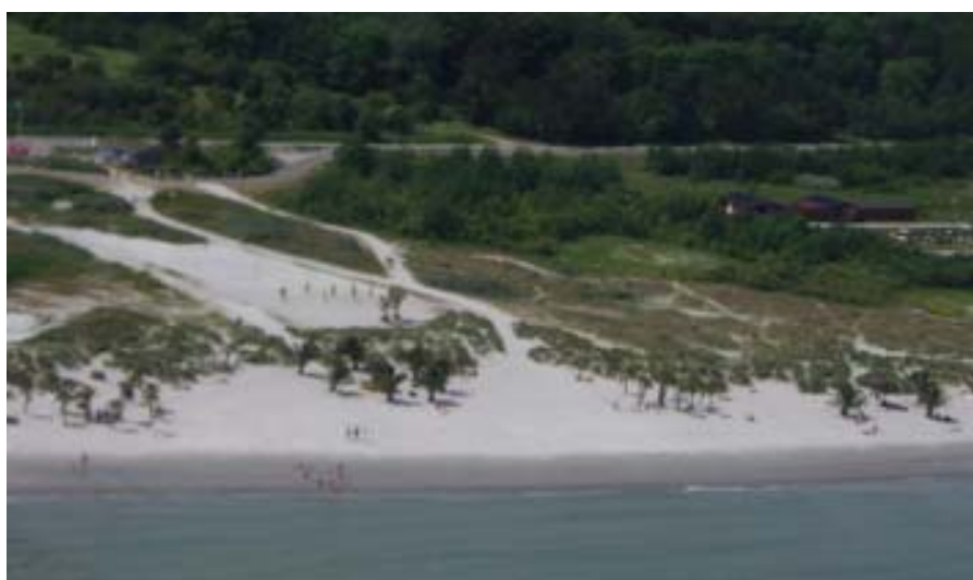
Kursisterne kan beskue Frederikshavn's palmestrand under en demonstrationstur med helikopteren

Vel tilbage på TAK, bød onsdag eftermiddag hele torsdagen og fredag formiddag, på fire planlagte simulerede øvelse i SAR/NAV træneren. Træneren består af 8 små afdelinger (kubikler) samt et antal instruktørpladser. Her kan instruktørerne så planlægge øvelserne, og de kan under gennemførelsen overvåge kom-