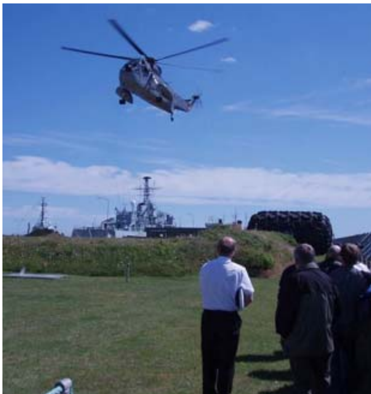
Sikorsky helikopter lander på Helo pad'en

Efter et slagsmål på en hurtigfærge er der 4 mand der er blevet kastet overbord. Kaptajnen har beregnet tidsrum og område. Vejret er jævnt blæsende med kraftig strøm. OCS har 4 Standard. Flex, hurtigfærgen og en S-61 redningshelikopter til sin rådighed i eftersøgningen. SOK har udregnet søgeområde, men nu er det OSC opgave at fordele ressourcerne i søgeområdet, på den bedst mulige måde under givne vilkår.