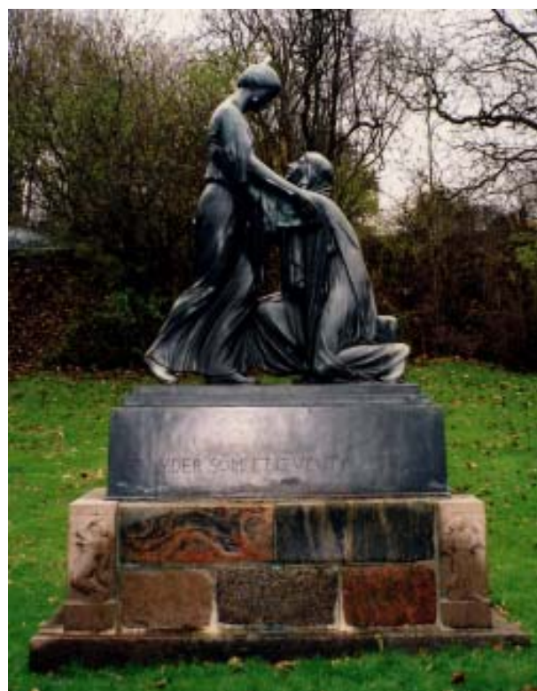
Monument for genforeningen 1920, opstillet i Randers

Derimod er det typiske 1. verdenskrigsmonument uden for Sønderjylland en søjle med relieffer ved havnen, hvilket afspejler, at de omkomne var søfolk og fiskere. Danmark var neutralt under krigen, og de omkomne var derfor hovedsageligt folk, der sejlede på de mine- og ubådsfyldte farvande. Men i Sønderjylland, som dengang hørte under Tyskland, og hvor befolkningen var pålagt tysk krigstjeneste, er det typiske monument en natursten, der står på kirkegården og minder de faldne, som ellers blev begravede på en fjern slagmark. Over 4000 sønderjyder omkom under krigen.