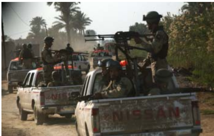
Den nye irakiske hær er ikke så imponerende som tidligere tiders militærparader