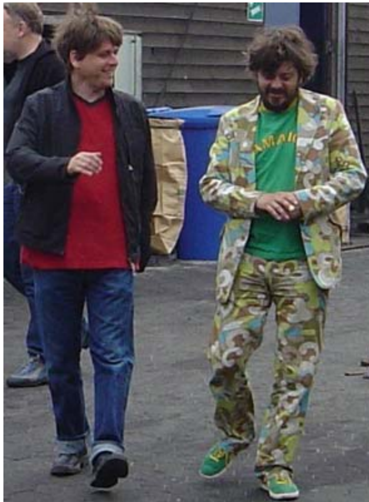
Peter og Anders Lund Madsen

Det er en dejlig søndag morgen i juni måned. Skolen er tom og stille, som den ligger der i morgensolen. Kun fuglenes sang bryder stilheden. Duggen anes på græsset, hvor den glimter som små krystaller. Et meget smukt syn. Man glemmer helt, at det var lidt surt da vækkeuret ringede tidligt sådan en søndag morgen. Besætningen tørner ind og skolen begynder at summe af aktivitet. Materiellet på brandpladsen bliver fundet frem og røgdykkerapparaterne klargjort. Hvad er det så, der kan skabe denne aktivitet på en normal fredelig fridag?