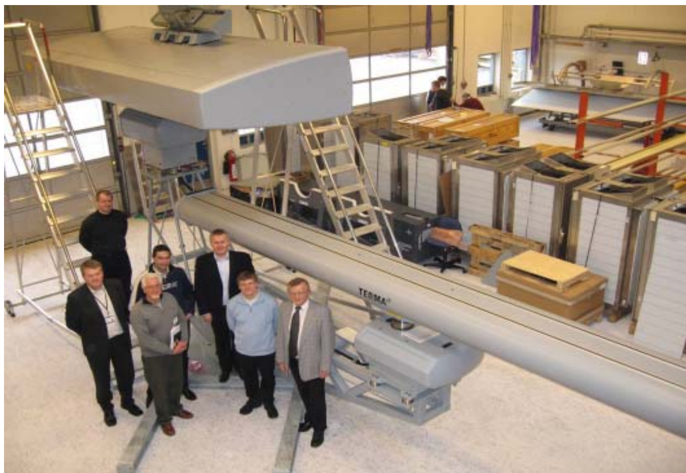
Scanter 4000 radar

KYRA bygge- og installationsfase påbegyndes sent i efteråret 2006 og forventes færdiggjort i efteråret 2008.