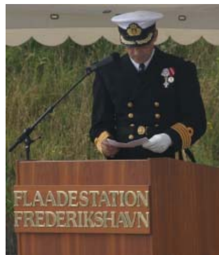
CH OPLOG taler

“Det er ingen hemmelighed, at de seneste par år har været drøje at komme igennem for mange her på flådestationen. Mange medarbejdere har følt sig meget utrygge ved de mange forandringer, og risikoen for afskedigelse eller omplacering. Det har også været en vanskelig periode for os i ledelsen, fordi vi ikke altid har kunnet dulme denne uro med fornuftige og præcise svar, simpelthen fordi vi ikke kendte dem selv. Men jeg er meget stolt af at kunne sige, at det er min opfattelse, at vi på trods heraf er fortsat med at yde topservice til flåden, i og udenfor arbejdstiden, til hverdag og i weekends, ferie eller ikke ferie, en opfattelse som jeg i øvrigt ofte - og fra mange sider - får bekræftet af vores kunder. Dette skyldes alene den kollektive arbejdsmoral og professionelle stolthed over et veludført job, som hersker - og altid har hersket - her på flådestation Frederikshavn“.