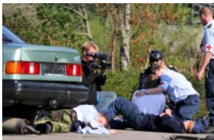
Førstehjælp ved biluheld