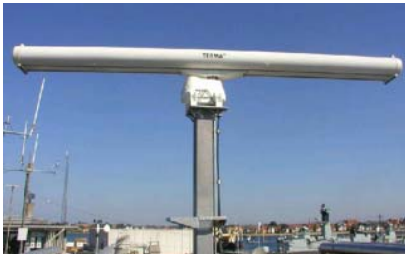
Scanter 2001 radar

En Scanter 4000 radar er en kombineret overflade- og lavluftvarslingsradar, der kan detektere og følge eksempelvis skibe samt lavtgående fly. En Scanter 4000 radar består af to roterende antenner og tilhørende radarudstyr.