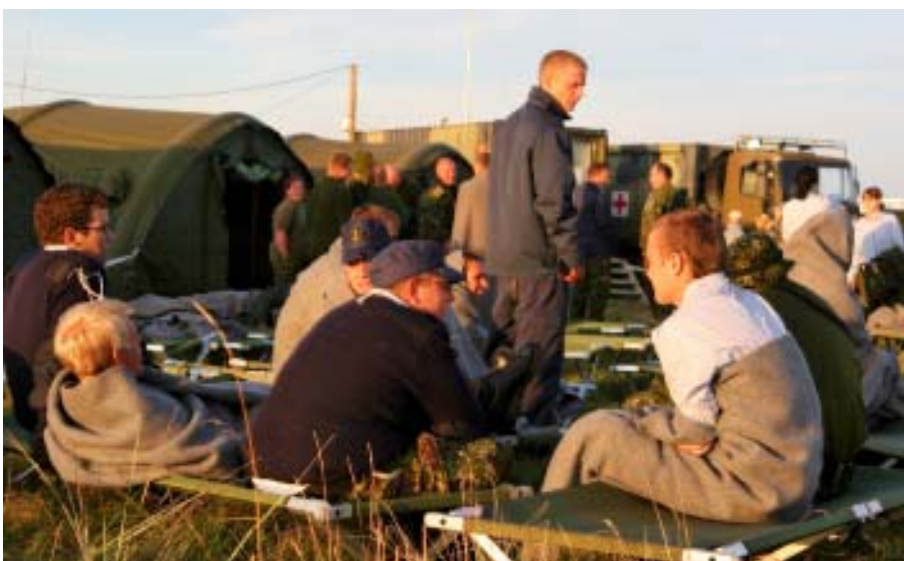
Venteplads med sanitethjælp

indsættes Beredskabsstyrelsens personel og materiel suppleret med personel fra skibene i den livreddende redningsaktion på skadesstedet. Her møder der hjælpestyrkerne et inferno af kaos. Fortvivlede beboere kaster sig over hjælpepersonellet for at få hjælp til at finde familiemedlemmer, redde personer, hjælpe sårede og syge. En meget stor og overvældende opgave, som sætter alle på prøve. Langsomt men sikkert opbygges et overblik over kaos og indsatsen begynder at tage form. Brande slukkes, personer reddes, skibe sikres mod at synke, bilvrag klippes op og personer bjærges ud af dem. Ventepladsen etableres på området og beboerne samles her for livreddende førstehjælp. Herfra etableres transport til basen med felthospitalet på stranden, hvor politi og læger står klar til at registrere og hjælpe. De hårdest sårede transporteres videre med helikopter ud til operationsstuer ombord i skibene. Samarbejdet mellem skibenes besætninger og Beredskabsstyrelsen forløber godt. Man begynder at udnytte hinandens specialviden og kunnen til for-