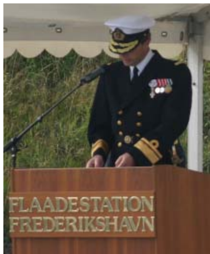
CH SOK taler

gelse af de to danske NRF-enheder korvetten PETER TORDENSKIOLD og Mineryd-ningsfartøjet STØREN. STEADFAST JAGUAR var en meget vigtig øvelse for NATO, idet øvelsen primært havde fokus på logistik med komplicerede adgangsforhold, og det blev bekræftet, at OPLOG konceptet virker og vil blive en vigtig del af søværnets samlede evne til at deltage i internationale opgaver. Sandsynligheden for OPLOG deltagelse i internationale opgaver, skal ses i lyset af, at den danske interessesfære ikke længere er begrænset til vores eget nærområde - danske interesser er også blevet ”globaliseret”.