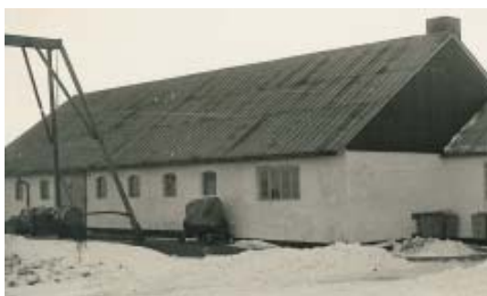
Bangsbo fort i 50'erne læs s. 14...