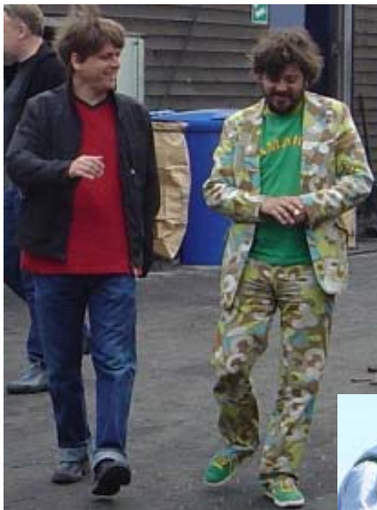
En anderledes dag på SHK læs s. 4...