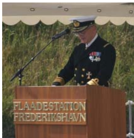
CH SMK taler

dermed ny aktivitet i de to flådestationer, der ellers havde haft NATO - og især vesttyske enheder - som hovedkunder. Med andre beredskabskrav - med kun udvalgte enheder på højt beredskab og resten på længere varsel - og i en verden, hvor Danmark ikke var i en kampzone kunne støttevirksomheden også ændre form. Det førte til udviklingen mod kun at oprettholde egne værksteder til de militære opgaver, der ikke kunne købes i byen hos civile leverandører og også til en ny arbejds- og opgave placering ved henholdsvis Flådestation Frederikshavn og Flådestation Korsør efter princippet kun et værksted til et givent teknisk område. Mange ændringer - og nogle selvfølgelig lettere at følge med i og tilvænne sig end andre. Alle har de haft deres rationale, og de har afspejlet at vi til enhver tid har tilpasset os de ændrede ydre vilkår i bestrebelsen på at altid at levere den bedst mulige service effektivt og økonomisk“.