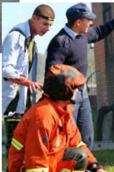
Danex på SHK læs s. 12...