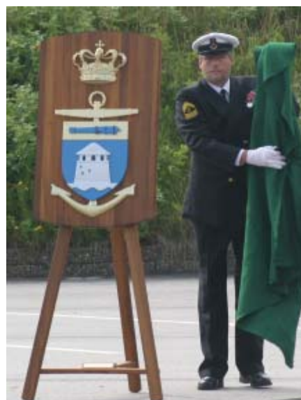
afsløring af våbenskjold

„Netop når man opretter en ny virksomhed har man de bedste muligheder for at skabe de fælles værdier og den moralske kontrakt imellem de ansatte, som kan være med til at skabe et godt arbejdsmiljø, høj arbejdssikkerhed og -arbejdskvalitet, arbejds glæde og job tilfredshed. Dette vil vi vide at gøre, med behørig respekt for de mange gode værdier og traditioner som vi har i søværnet. Men det forudsætter, at alle medvirker positivt fra starten. Korslagte arme og selvtilstrækkelighed er attituder som er uforenelige med service og fremdrift”.