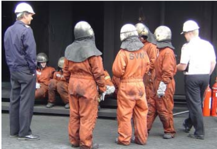
Klar til brandslukning