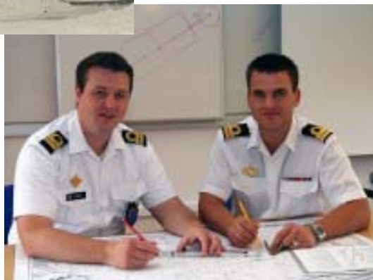
Norske elever på TOK læs s. 18...