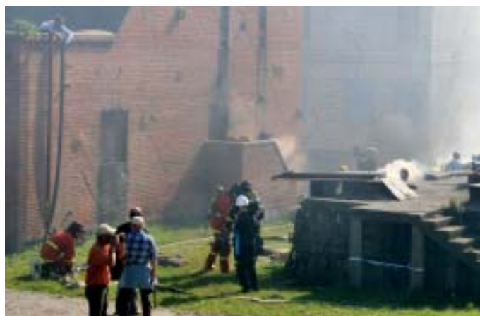
Brandslukning i ruinbyen

Det har været et stort arbejde, at skabe og tilrettelægge øvelsen, men når man ser resultatet af anstrengelserne, så har det været det hele værd.