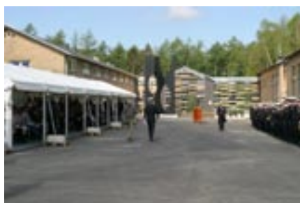
Gæster og parade venter.

Skolens stolthed er det nyetablerede træningsbassin, hvor eleverne under realistiske forhold kan træne overlevelse til søs.