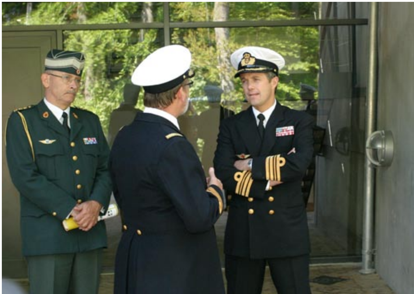
Skolechefen fortæller H.K.H Kronprins Frederik om skolens udenomsfaciliteter

enkeltværelser med hotellignende standard. Der er indrettet nye klasseværelser, nyt køkken, nye kontorer, nyt træningsbassin, ny militær femkampbane i tilknytning til idrætsanlægget, nyt auditorium og endelig er der indkøbt en moderne skydesimulator som placeres i kælderen ved træningsbassin med tilhørende klasseværelse og depotrum.