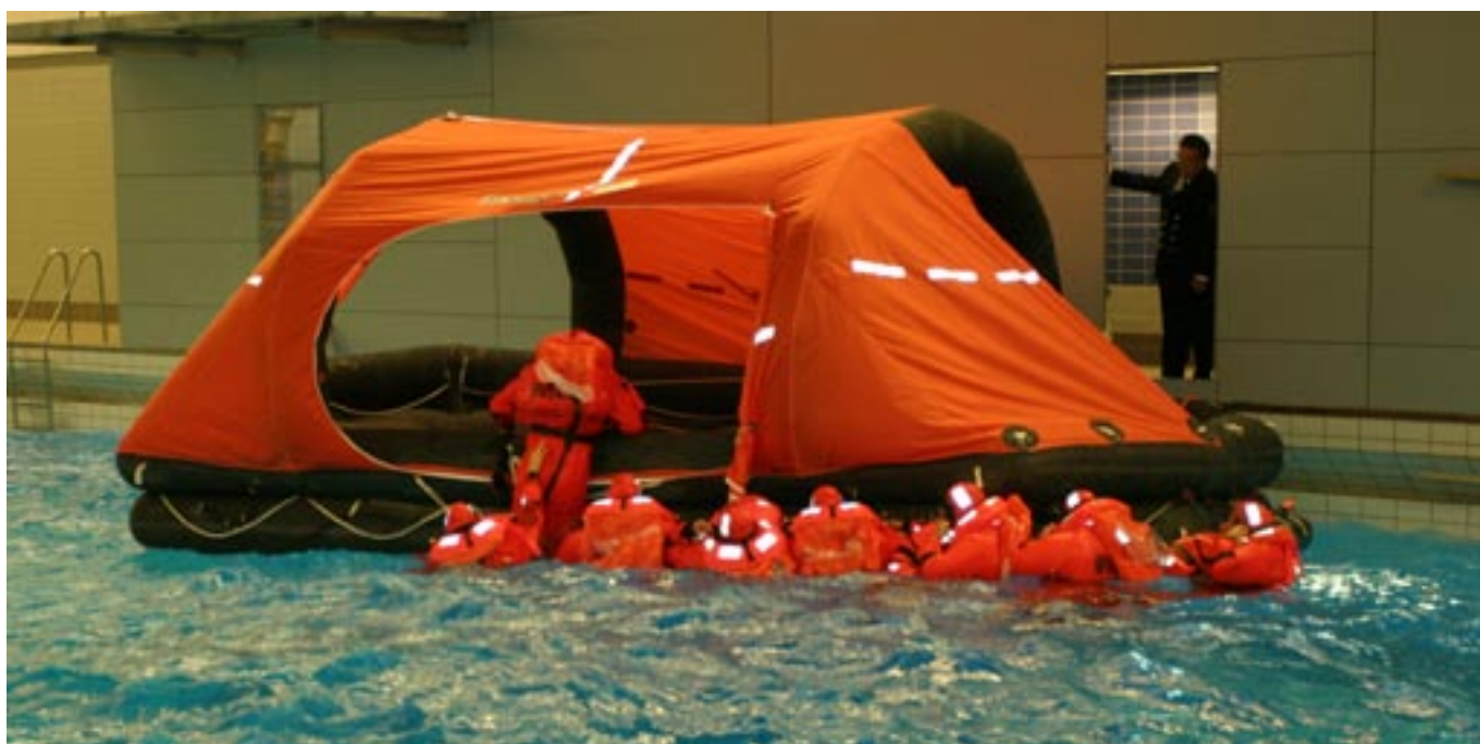
Nogle af skolens elever demonstrerede træningsbassinetts anvendelses muligheder.

Med et anlægsbudget på 155 mio. kr. er nybyggeriet på SSG det største enkeltbyggeri i det forsvarsforlig, der løber fra 2005 til 2009. Overnatningskapaciteten har fået et tiltrængt løft med 104 nye