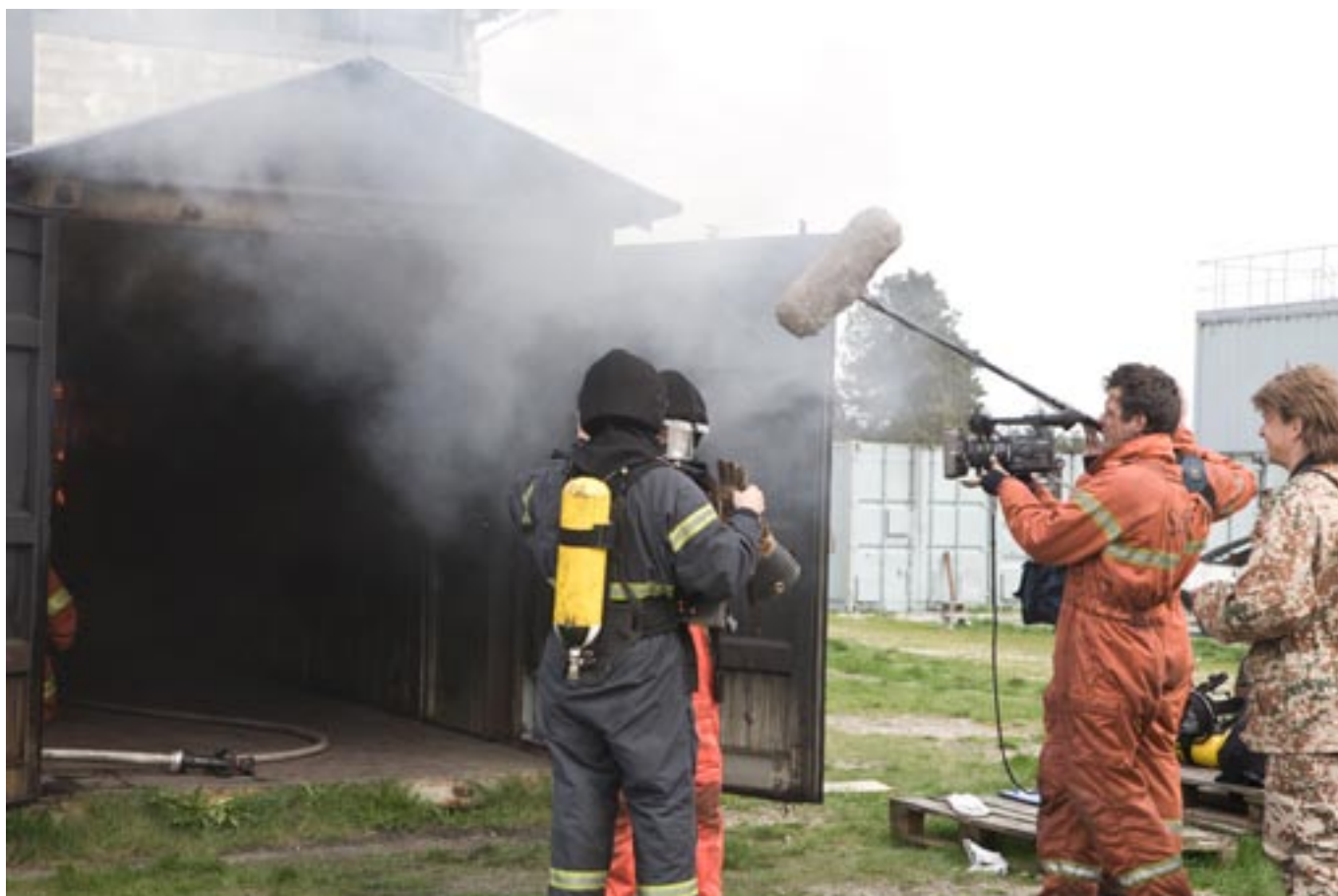
Filmholdet fik også varmen under besøget.

holdet og BS havde SHK medarbejdere sammensat et fint program den 29 april for Bubber, hvor han fik lejlighed til sammen med BS at prøve de udfordringer der lægger i, at arbejde som røgdykker i et brændende skib og i et rum, som vandfyldes med iskoldt vand. Optagelserne strakte fra kl 1330 til kl 2100. Mange timer, som i den endelige og færdige version sandsynligvis ikke fylder mere end 5 minutter. For medarbejdere og kursister var Bubbers besøg en oplevelse. Et sjovt og anderledes indslag i hverdagen. Mange benyttede lejligheden til, at få taget et billede sammen med Bubber og BS eller en autograf.