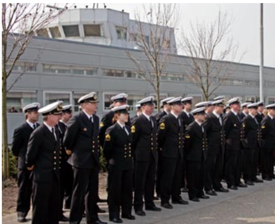
Personellet opstillet til parade foran skolen.

i verden - om personellet er i klasselokalerne på TAK, eller er i egen enhed langs kaj, eller i egen enhed på vej til en mission langs Afrikas kyst". En dejlig dag i Frederikshavn. Efter således at have markeret synspunkterne må det konstateres at alle de tilstedeværende havde en fremragende dag i forbindelse med overdragelsen af bygningen. Bygningerne, der tilsammen udgør en størrelse på ca. 5700 m 3 giver Søværnets Taktikkursus mulighed for at gøre en forskel i forhold til ambitionerne om at være på forkant i forbindelse med træning af personel, der blandt andet skal være i stand til at kunne udsendes i skarpe operationer, uanset om disse omfatter piratbekæmpelse, fredsbevarende eller fredsskabende missioner.