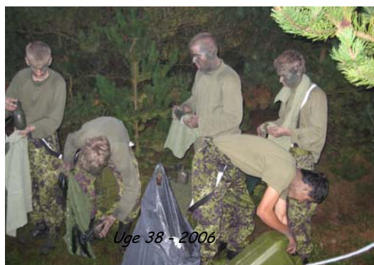
Uge 38 - 2006

De var også hårde imod os, men på den rigtige måde. Vi skulle jo også mærke, hvad det vil sige at være soldat. De fortalte også meget om strukturen indenfor Forsvaret/Hæren. Alt i alt en vild spændende uge, der gav os en idé om soldater livet.