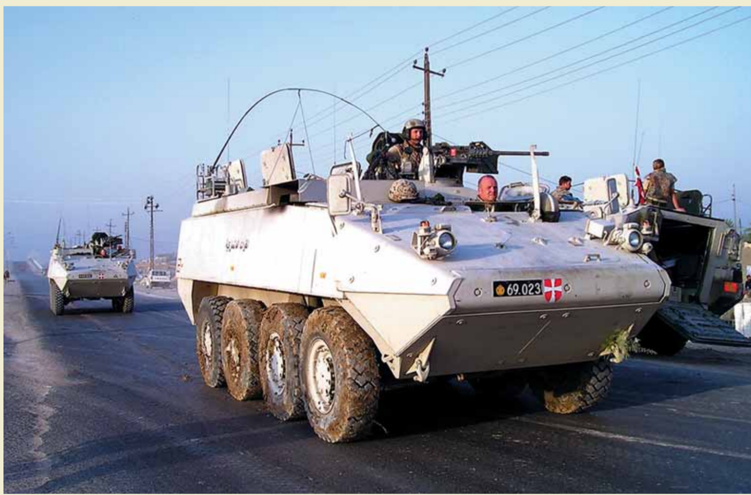
Fokus er rettet mod den danske internationale indsats. Siden 1992 har danske soldater bevæget sig hjemmefant på Balkan, i ørkensand og i Afghanistans bjerge. Forsvaret har i de senere år anskaffet meget nyt materiel, herunder kampvogn Leopard 2, som i dansk udgave er blevet opdateret til version A5 (herunder), samt den pansrede mand-skabsvogn Piranha (herover), der også er anskaffet i en ambulanceudgave. I de kommende år tilføres hæren yderligere et antal infanterikampkøretøjer af typen CV 9035 (svensk).

Hærens nye basisuddannelse (HBU) giver på fire måneder den værnepligtige en grunduddannelse, der omfatter såvel civile som militære discipliner. Fra HBU'en kan soldaten vælge at tegne en kontrakt til en reaktionsstyrkeuddannelse med henblik på senere at blive sendt ud i en international mission.