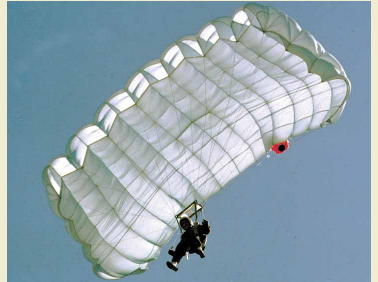
Jægerkorpset spiller en væsentlig rolle i forbindelse med internationale operationer. Hvad korpset specifikt laver hører imidlertid under begrebet operationssikkerhed – men givet er det, at andre danske og internationale styrker er meget glade for de informationer, som jægerne skaffer.

Geografisk placering af Hærens Operative Kommandos operative og uddannende myndigheder.