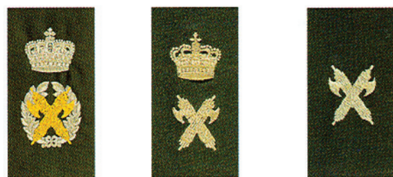
Generalauditor Auditor Auditørfuldmægtig