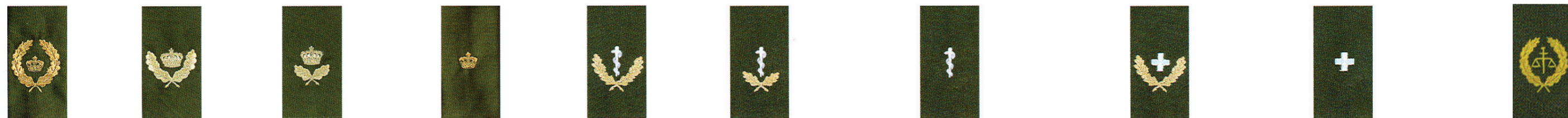
Civil, chefniveau (C400) Civil, lederniveau (C300) Civil, mellemniveau (C200) Civil, manuelt niveau (C100) Speciallæge/Special tandlæge Læge/tandlæge uden auto. til selvstændig virke Ledende Afdelingssygeplejerske Afdelingssygeplejerske Sygeplejeassistent Militærjuridisk rådgiver