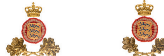
Overvagtimester, overkontorbetjent og leder af etablisementsforvaltningen Vagtbetjent, kontorbetjent og øvrigt personel ved etablisementsforvaltningen