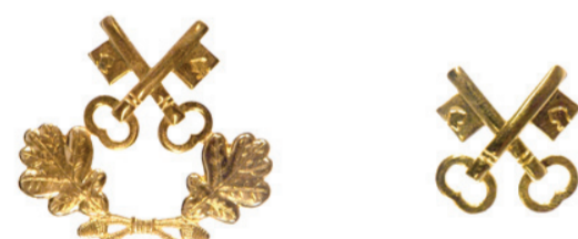
Leder af etablisementsforvaltningen Øvrigt personel ved etablisementsforvaltningen