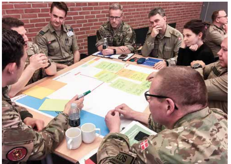
Størstedelen af pladserne til Forsvarets uddannelser besættes af ansøgere, der er værnepligtige, tidligere værnepligtige eller allerede ansatte i Forsvaret. Det kræver et godt og koordineret samarbejde på tværs af koncernen at rekruttere internt. Derfor blev FNIRFU oprettet i 2017.

”Vi har på tværs af gruppen en lang række forskellige og sammenhængende opgaver inden for den interne rekruttering. Dette samarbejde glider langt lettere, når man kender hinanden og har opnået en fælles forståelse, tilgang, ’mindset’ og viden.” ■