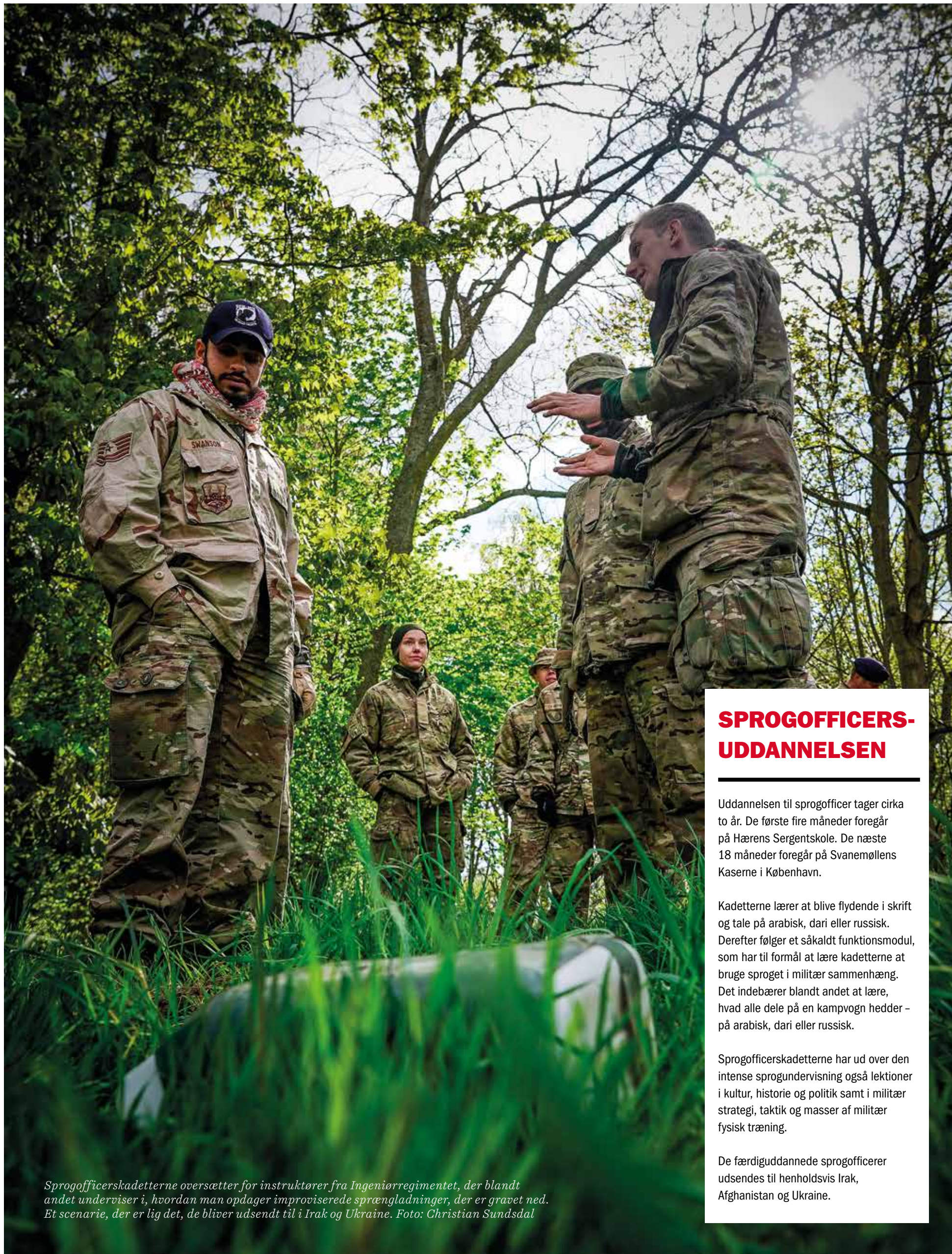
Sprogofficerskadetterne oversætter for instruktører fra Ingeniørregimentet, der blandt andet underviser i, hvordan man opdager improviserede sprængladninger, der er gravet ned. Et scenarie, der er lig det, de bliver udsendt til i Irak og Ukraine.