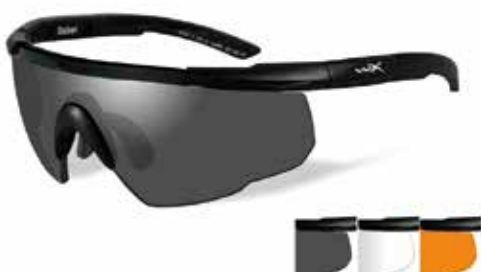
Wiley X Saber Advanced