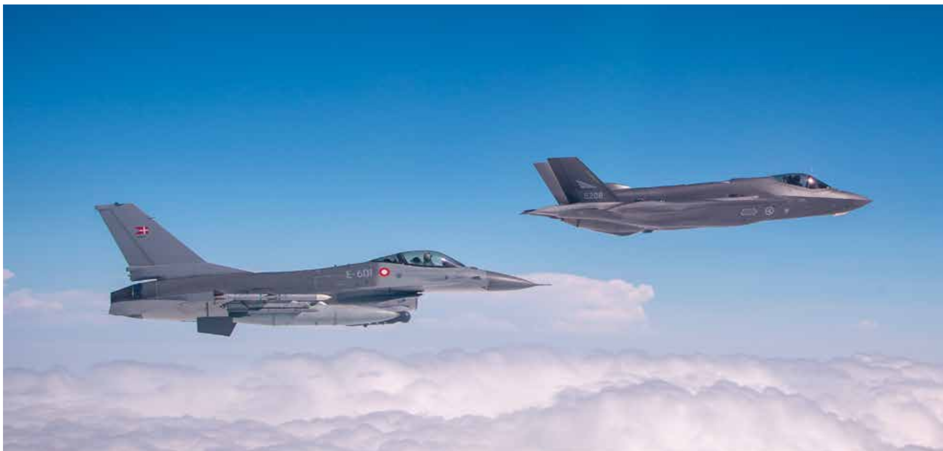
De danske F-16-fly eskorterede de besøgende norske F-35-fly i dansk luftrum under besøget i maj.

AF SIMON ELBECK / FKO