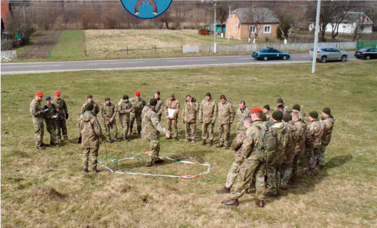
Siden 2016 har danske militærpolitisoldater afholdt kurser for ukrainske soldater på Military Law and Order Service i Lviv. Det seneste hold var af sted i marts, hvor dette billede blev taget.