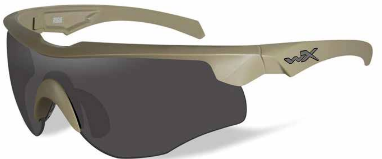
Wiley X Rogue Comm

De nye briller forventes leveret ultimo 2019 og vil blive indfaset i takt med, at nuværende lagerbeholdninger opbruges. ■