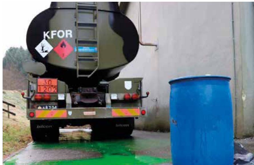
Alle riste og kloakdæksler i det forurenede område dækkes til, så uheldet ikke spredes sig gennem kloaknettet.