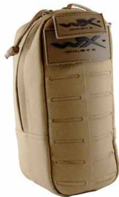
Tasken til fragmentationsbriller