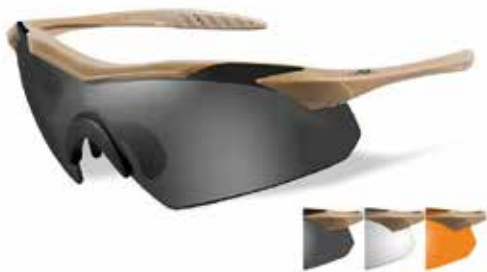
Wiley X Vapor