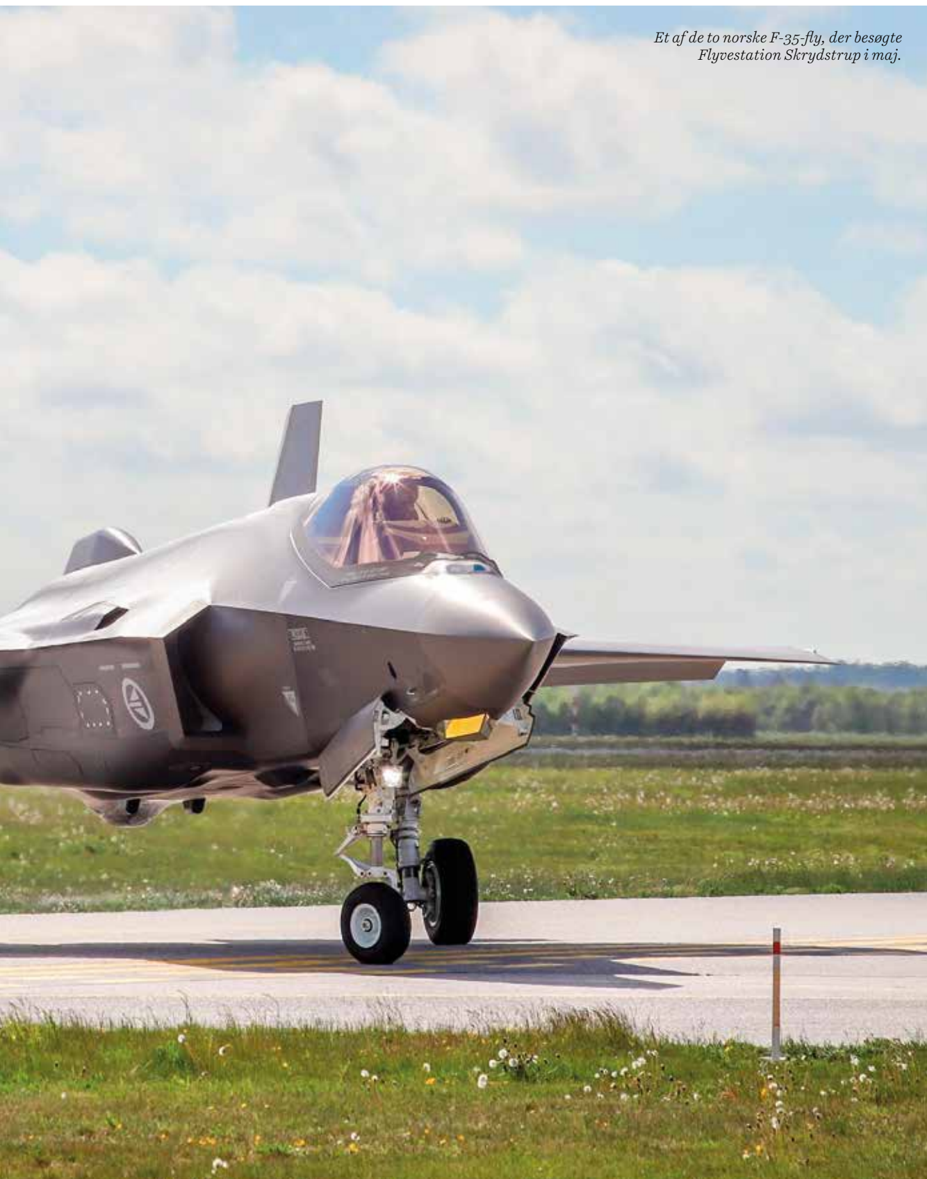
Et af de to norske F-35-fly, der besøgte Flyvestation Skrydstrup i maj.

”Det var oprindeligt meningen, at flyene skulle operere fra et eksisterende bygningskompleks på flyvestationen. Men hele dialogen omkring støjen fra de nye kampfly gjorde, at Forsvarsministeriet valgte at flytte F-35-komplekset til det område på flyvestationen, hvor den såkaldte terminalstøj reduceres mest muligt for de omkringliggende områder. Det betyder, at de nye fly kommer til at operere fra et område næsten midt imellem de tre nærmeste landsbyer. Det gjorde også, at bygningsprojektet skulle begynde forfra, og at der skulle designes et nyt kompleks til F-35,” fortæller chefen for Flyvestation Skrydstrup, oberst Uffe ”GUS” Holstener.