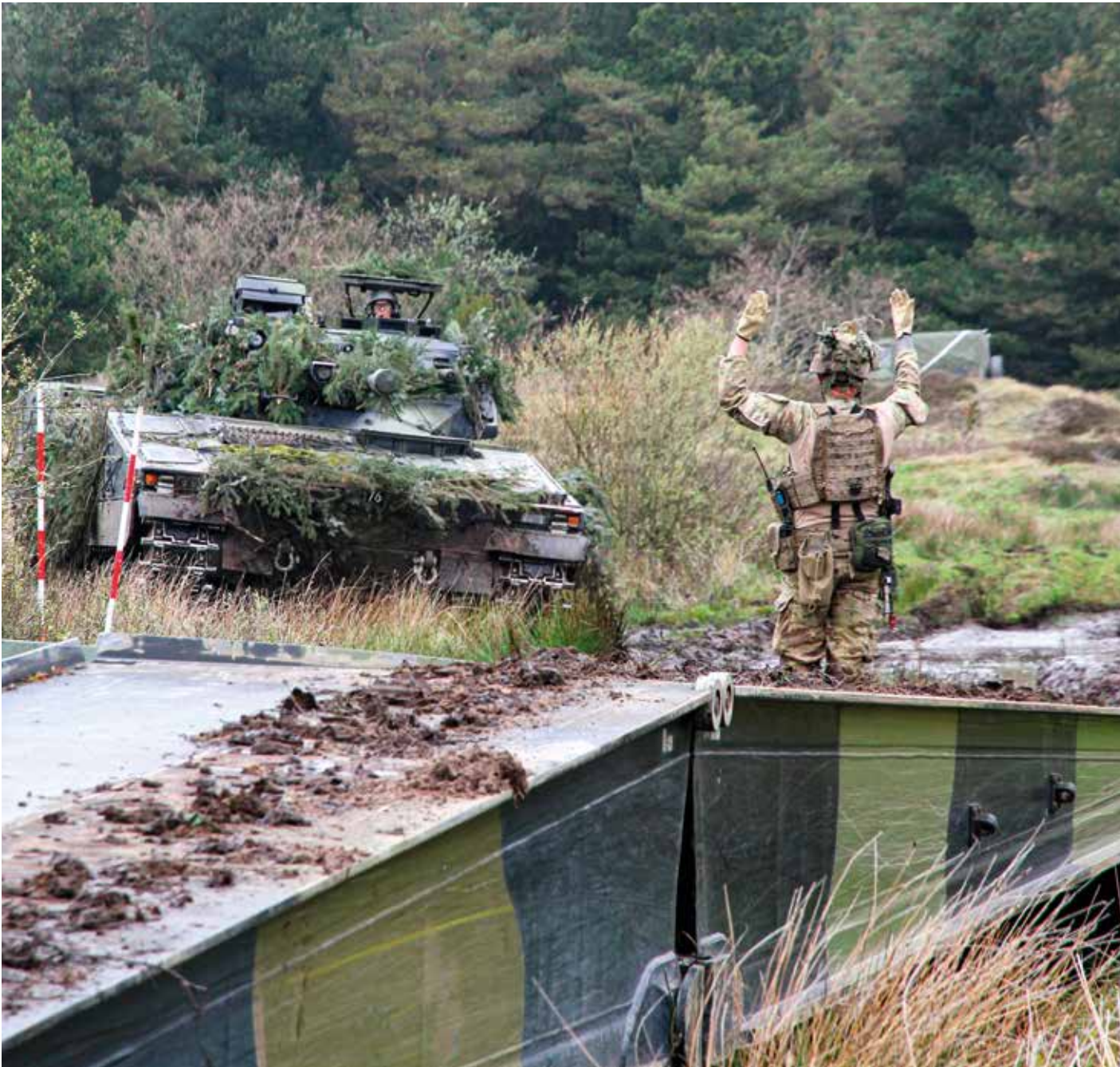
Ingeniørsoldater lægger en panserbro under øvelsen med I Panserinfanteribataljon fra Gardehusarregimentet.