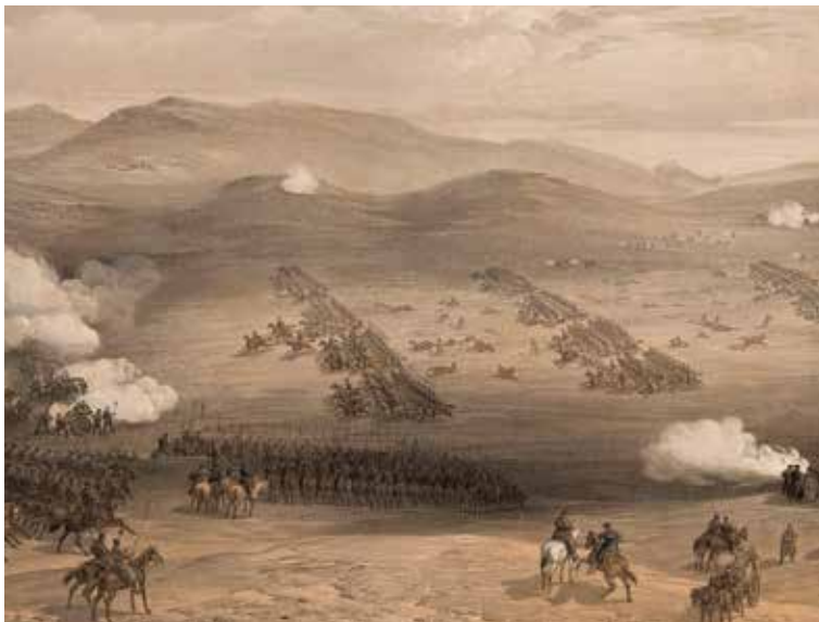
Illustration: Bibliothèque nationale de France