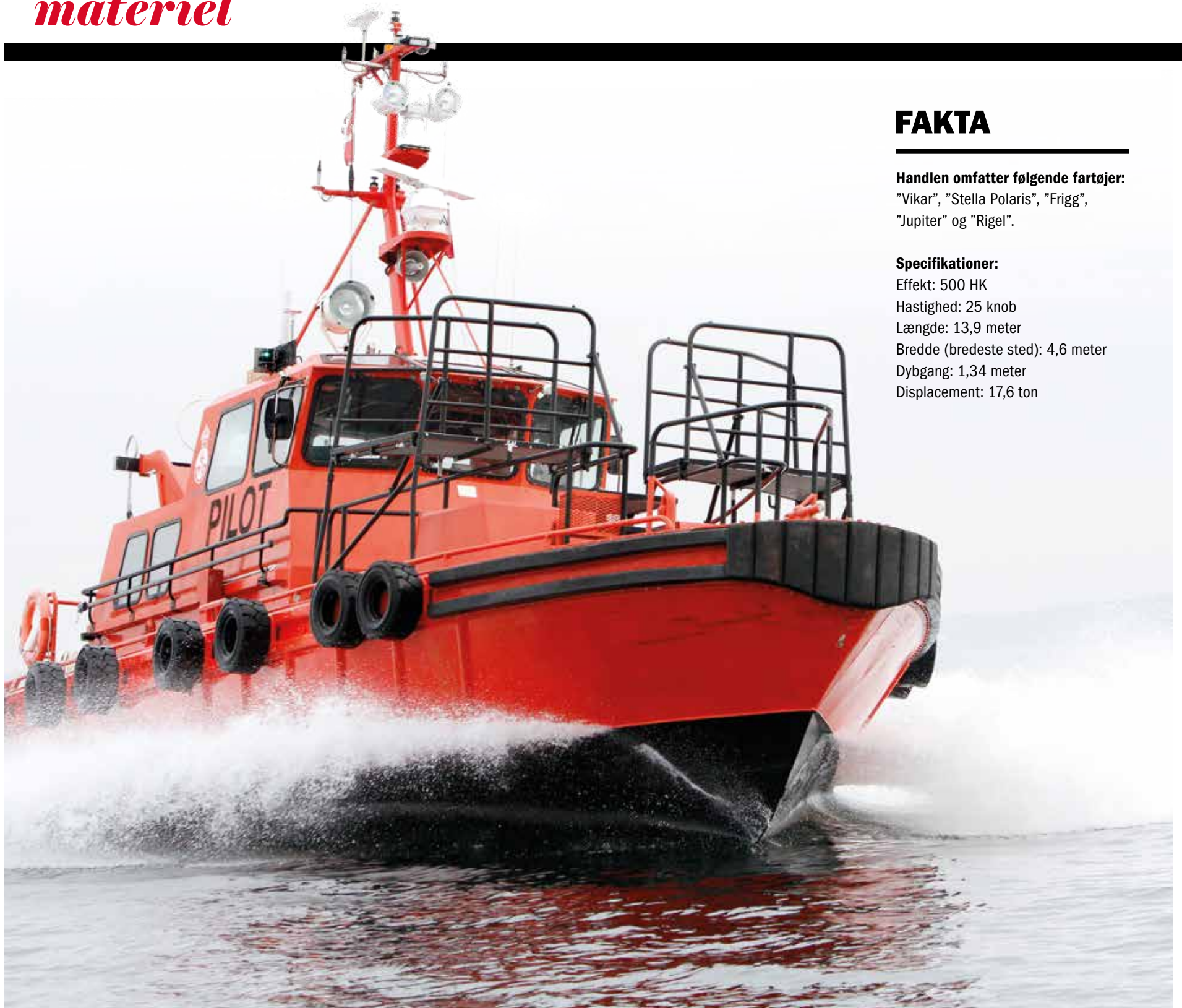
De nyindkøbte patruljefartøjer indsættes blandt andet i rammen af Frontex-missionen til overvågning af Europas ydre grænser.