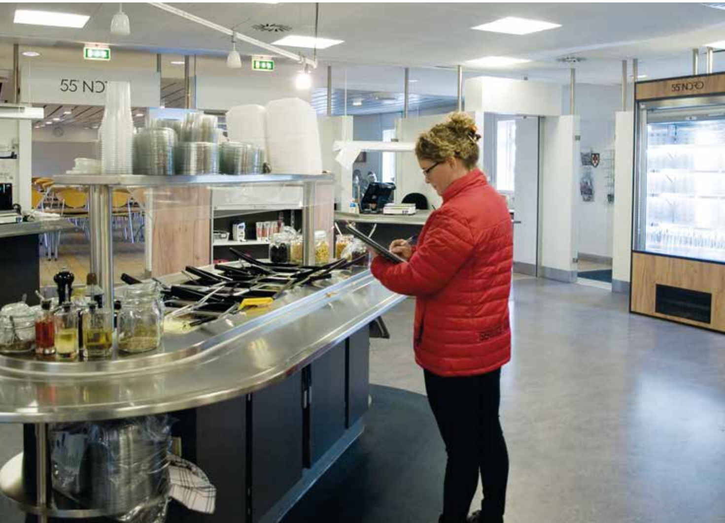
Service Manager på Oksbøl Kaserne tager en stikprøve på udvalget i kantinens frokostbuffet.

Forsvarsministeriets Ejendomsstyrelse (FES) og ISS gennemførte i februar-marts 2019 en undersøgelse af, hvordan brugerne oplever de services, ISS og FES leverer i dagligdagen. Den samlede tilfredshedsscore på landsplan landede på 3,36 på en skala fra 1-5. FES og ISS har aftalt i kontrakten, at brugertilfredsheden minimum skal være på 3,58 på en skala fra 1-5. Resultatet er dermed stadig under det aftalte niveau, om end der er en positiv udvikling i forhold til forrige undersøgelse, hvor resultatet var 3,24. Det er dermed en stigning på 0,12. Resultaterne er nu omsat til lokale handleplaner for hvert af de syv FES-distrikter, hvor man tager fat på specifikke lokale udfordringer, der kan bidrage til at forbedre brugernes oplevelse. For eksempel vil ISS og FES i fællesskab se på at forbedre oplevelsen af møde- og undervisningslokalerne ved hyppigere soignering af lokalet og oplysninger på kontaktpersoner, der kan afhjælpe fejl. Der arbejdes også på en tydeligere opdeling og skiltning i kantinernes buffet og portionsalg. Efter sommerferien vil der køre en kampagne, hvor FES fortæller, hvilke tiltag der er iværksat i dit område (FES distrikt).