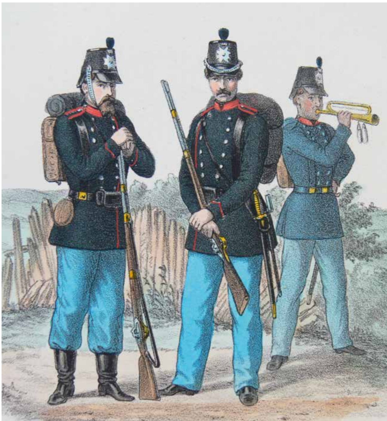
To menige og hornblæser. Kunstneren har glemt at give dem bataillonsnummer på skulderklapperne. Koloreret stik af ukendt kunstner, 1864.

Slesvigske Fodregiment anno 2019 har altså en lang historie. Den skal flettes ind i det moderne regiment. Men historie er ikke alt. Korpssånd kommer mange steder fra, alt efter hvilken generation man tilhører. Morten mener ikke, at unge værnepligtige og befalingsmænd har den