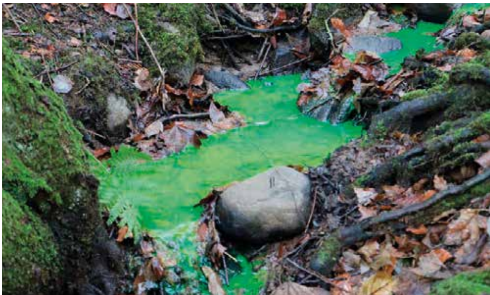
Det grønne farvestof, der simulerer spildt dieselolie, finder vej gennem en regnvandsbrønd og ud i en lille bæk uden for hegnet.