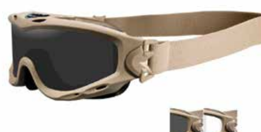
Tætsluttende fragmentationsbriller/Goggle med elastik bag om hovedet.