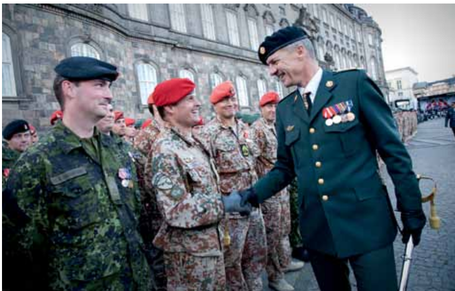
Nick Hækkerup Forsvarsminister

” Vores aftryk i verden er større end vores geografiske størrelse. Jeres aktive indsats og bidrag for at skabe fred, frihed og sikkerhed giver os indflydelse, resultater og respekt.