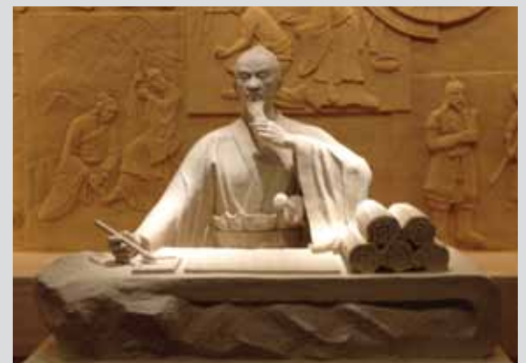
Forsvarsakademiet var inviteret af Academy of Military Science (AMS) i Beijing.

For stabskursisterne var rejsen således en øjenåbner, ikke blot for kinesisk kultur og levemåde, men for hvordan kinesisk ledelsesfilosofi og det kinesiske forsvars opbygning og funktion spiller ind i de interesser, Kina har i forhold til det internationale system. ■