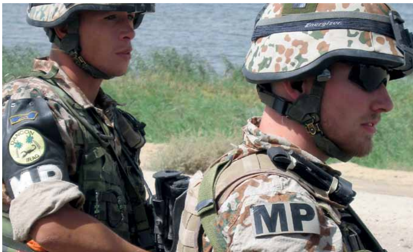
MP'er i Irak

Allerede nu, er der planlagt opstart for yderligere et hold piloterelever til februar 2014. ■