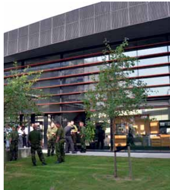
Reserveofficerne bliver videreuddannet i skønne omgivelser på Forsvarsakademiet.

VIDEREUDDANNELSE: I en årrække har der ikke eksisteret en videreuddannelse for officerer af reserven. Den tid er nu omme. Forsvarsakademiet har genoprettet Videreuddannelsestrin II for officerer af reserven. De 10 første reserveofficerer begyndte uddannelsen den 19. marts, og tre har indtil videre gennemført. Uddannelsen udbydes i et samarbejde med de øvrige kurser og moduler på akademiet. Den består af tre obligatoriske moduler i henholdsvis militær ledelse og styring, militær strategi og militære operationer samt et valgfrit modul. Man kan strække uddannelsen over to år. ■