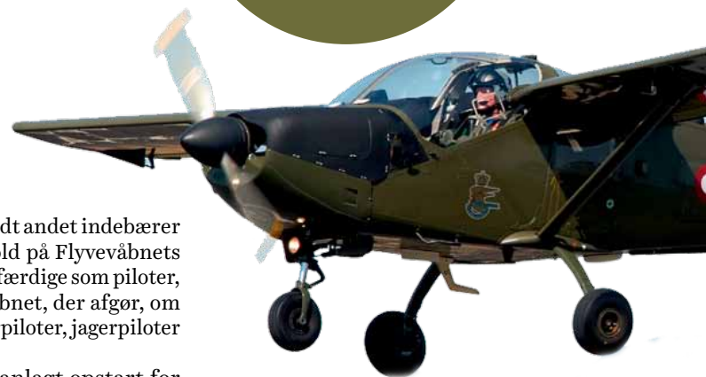
T-17 er flyvevåbnets træningsfly og det første, som piloter selv får lov at flyve.

AF DANSKERNE HAR EN ERHVERVSFAGLIG UDDANNELSE